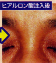
ヒアルロン酸注入後