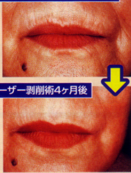
レーザー剥削術4ヶ月後